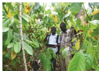
Exploitation forestière durable