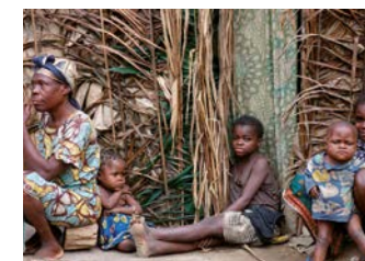
Tribu Baka, Pauvreté