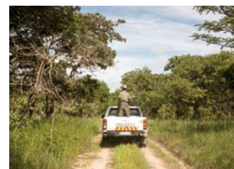
Patrouille, garde forestier